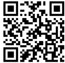
環境教育中心-課程報名系統